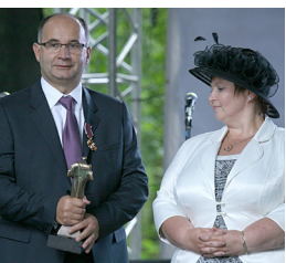
AMERICAN HEART OF POLAND SA